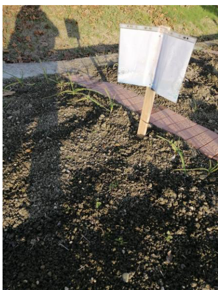
2^A Buon Pastore – dicembre 2023

Per la sezione della scuola dell'infanzia Il Melograno gli scambi via mail si sono limitati all'invio degli auguri.