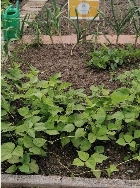
2^C Buon Pastore