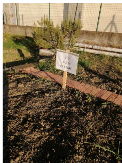
2^B Buon Pastore – dicembre 2023