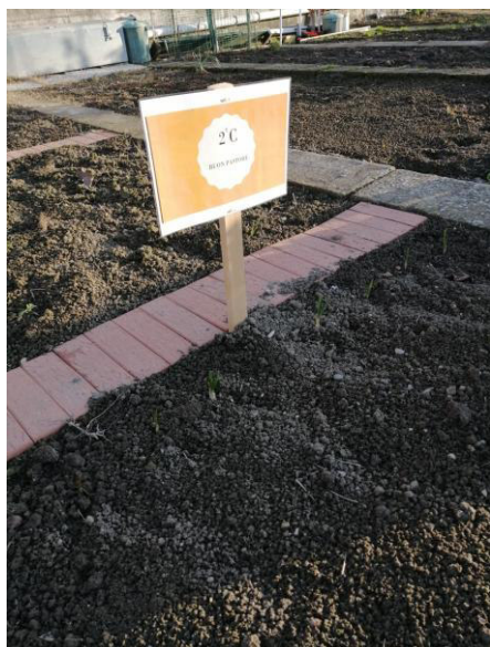
2^C Buon Pastore – novembre 2023