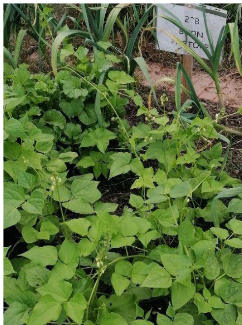
2^B Buon Pastore