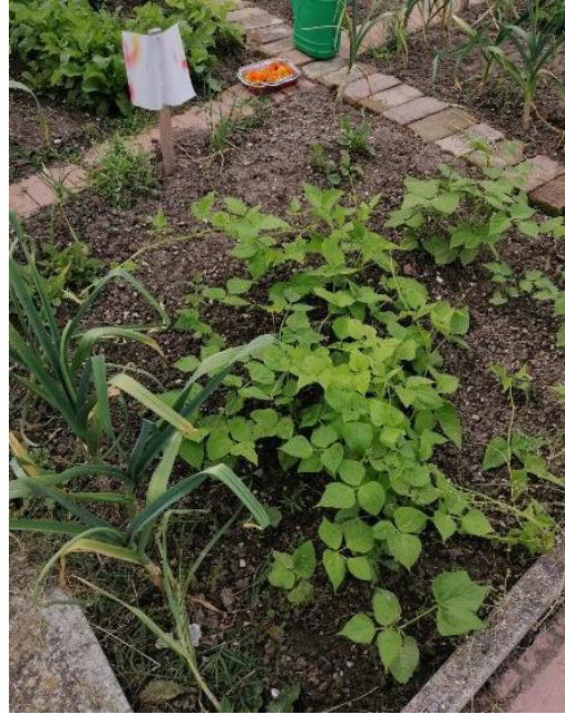
2^A Buon Pastore