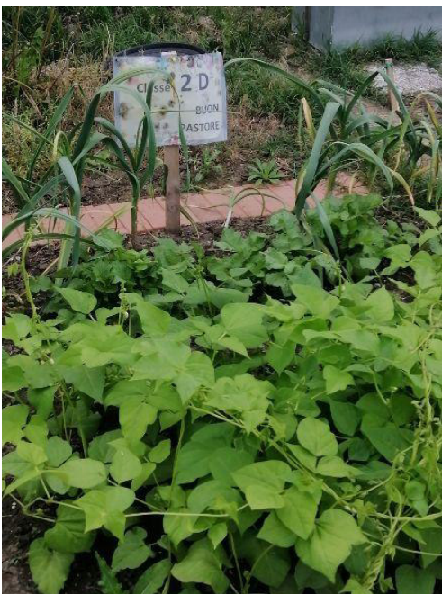
2^D Buon Pastore