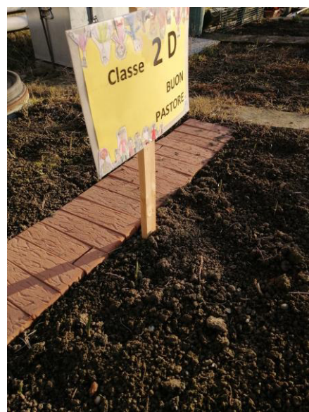
2^D Buon Pastore - dicembre 2023