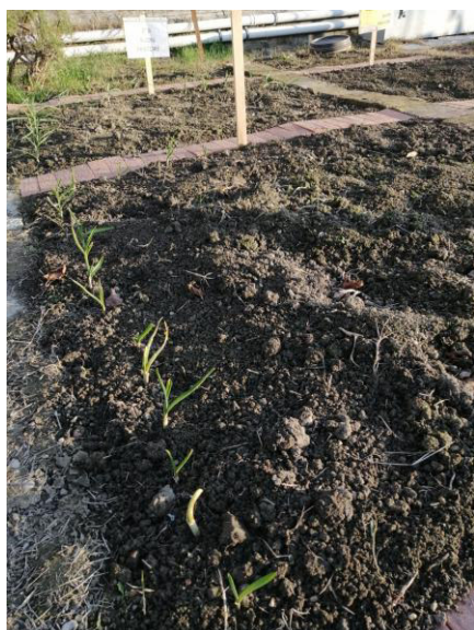
2^B Cittadella – dicembre 2023