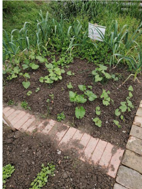
2^B Buon Pastore