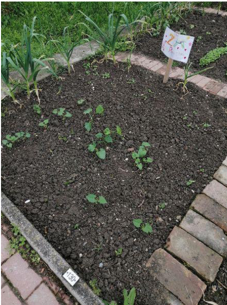
2^A Buon Pastore